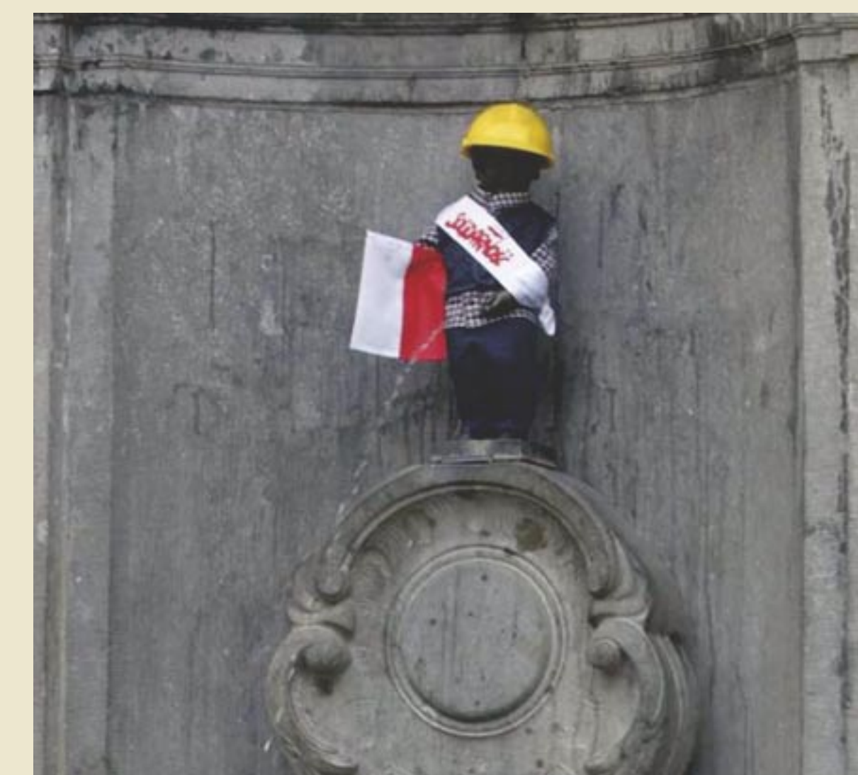
Belgia. Symbol Brukseli, siusiający chłopiec, przebrany za stoczniowca 14.09.2005 Bruksela

Zachęcamy do nadsyłania kronik z działalności Szkolnych Klubów Europejskich. Szkoły zainteresowane popularyzacją dokonaj swoich klubów prosimy o nadsyłanie zdjęć i opisów organizowanych działań na adres: centrum@federacja.krakow.pl