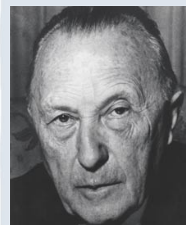
Konrad Adenauer (1876-1967)

Jeden z wielkich inspiratorów zjednoczonej Europy Konrad Adenauer urodził się w Kolonii w rodzinie urzędnika średniego szczebla. Ukończył studia na wydziale ekonomii i prawa na uniwersytetach we Freiburgu, Monachium i Bonn. W 1917 roku, na początku swojej kariery politycznej objął stanowisko nadburmistrza Kolonii. Po wojnie został współzałożycielem CDU w strefie okupowanej przez Wielką Brytanię. Po wygranych przez chadecję wyborach w 1949 roku, dwudziestosiemioletni wówczas Adenauer dostał zaszczytu objęcia funkcji pierwszego kanclerza RFN. Adenauer już od 1919 roku snuł plany o zintegrowanej Europie. „Mam nadzieję, że w niezbyt odległej przyszłości zostaną utworzone Stany Zjednoczone Europy, do których należeć będą Niemcy” - mówił w marcu 1946 roku. Za gwarancję pokoju w Europie uważał konieczności pojednania Francji i Niemiec. Tak skonstruowana zjednoczona Europa miała zapewnić Niemcom udział w powojennym układzie sił na arenie międzynarodowej, jak również miał zachować pokój w Europie. Brał udział w pracach nad powołaniem Europejskiej Wspólnoty Węgla i Stali i zawarcia Paktu Elizejskiego z Francją. Adenauer wycofał się z życia politycznego Niemiec i Europy w roku 1963.