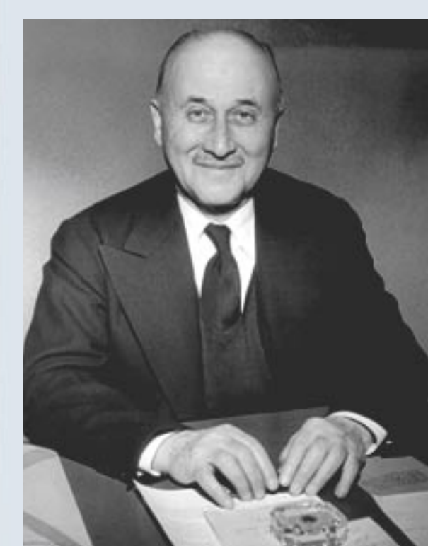
Jean Monnet (1888-1979)

Jeden z wielkich inspiratorów zjednoczonej Europy Konrad Adenauer urodził się w Kolonii w rodzinie urzędnika średniego szczebla. Ukończył studia na wydziale ekonomii i prawa na uniwersytetach we Freiburgu, Monachium i Bonn. W 1917 roku, na początku swojej kariery politycznej objął stanowisko nadburmistrza Kolonii. Po wojnie został współzałożycielem CDU w strefie okupowanej przez Wielką Brytanię. Po wygranych przez chadecję wyborach w 1949 roku, dwudziestosiemioletni wówczas Adenauer dostał zaszczytu objęcia funkcji pierwszego kanclerza RFN. Adenauer już od 1919 roku snuł plany o zintegrowanej Europie. „Mam nadzieję, że w niezbyt odległej przyszłości zostaną utworzone Stany Zjednoczone Europy, do których należeć będą Niemcy” - mówił w marcu 1946 roku. Za gwarancję pokoju w Europie uważał konieczności pojednania Francji i Niemiec. Tak skonstruowana zjednoczona Europa miała zapewnić Niemcom udział w powojennym układzie sił na arenie międzynarodowej, jak również miał zachować pokój w Europie. Brał udział w pracach nad powołaniem Europejskiej Wspólnoty Węgla i Stali i zawarcia Paktu Elizejskiego z Francją. Adenauer wycofał się z życia politycznego Niemiec i Europy w roku 1963.